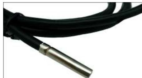
Рис.4 Термодатчик DS18B20