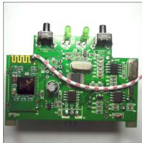
Рис.2 Блок управления.

Блок питания. Подключение нагрузки и питания.