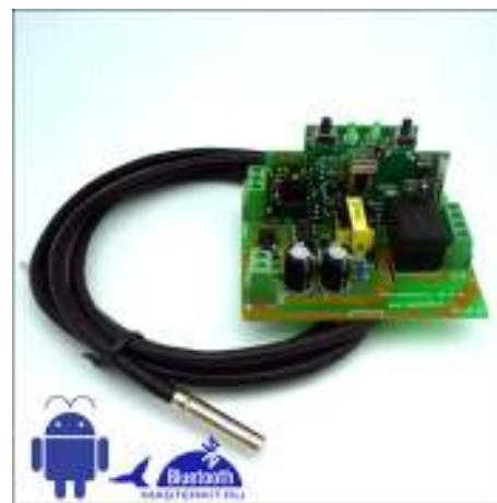
Рис.3 Устройство в сборе.