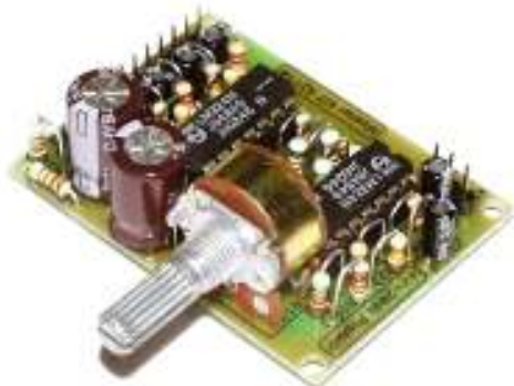
Рис.1 Общий вид устройства

Данный блок представляет собой простой и надежный предварительный стереофонический регулируемый усилитель с балансными входами, обладающий малым уровнем собственного шума, максимальной функциональностью и широким диапазоном питающих напряжений. Предварительный усилитель устанавливается между линейным(и) или мощным(и) выходом(ами) источника сигнала и входом(ами) усилителя(ей) мощности для регулировки уровня полезного сигнала на его выходе. Это устройство специально разработано для использования как в домашних условиях (в составе Вашего домашнего аудио/видео комплекса), так и в Вашем автомобиле (при формировании сигнала для автомобильного УМ).