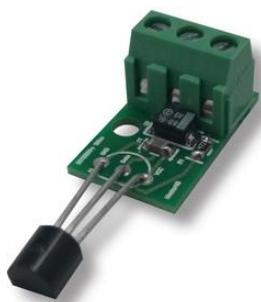
Общий вид устройства. Рис.1

Модуль предназначен для удаленного измерения температуры с помощью устройств на базе микроконтроллера. Например, плат Arduino или Raspberry.