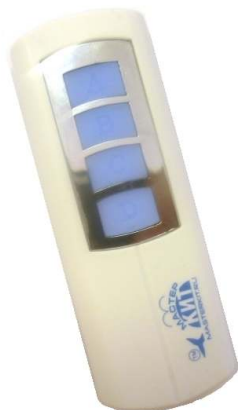
Рис. 1 Внешний вид

Пульт предназначен для управления устройствами по радиоканалу частотой 433,92 МГц. MP329 образует с управляемыми устройствами систему с обратной связью. Благодаря этому известно, выполнена команда или нет, если объект управления находится вне зоны видимости пользователя.