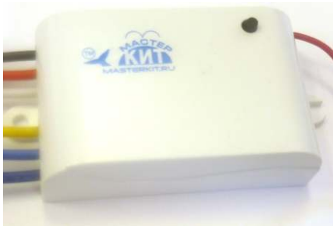
Рис. 1 Внешний вид

Устройство представляет собой одноканальное реле и предназначено для коммутации нагрузки по радиоканалу частотой 433,92 МГц. Важной особенностью MP328 является обратная связь с устройством управления. Благодаря этому известно, выполнена команда или нет, если объект управления находится вне зоны видимости пользователя.