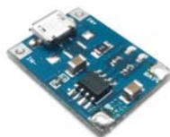
Общий вид устройства. Рис.1

Для более полного заряда АКБ, ток заряда должен составлять 37% от ее емкости. Например, при емкости АКБ 1000 мА ток заряда должен составлять в районе 400 мА.